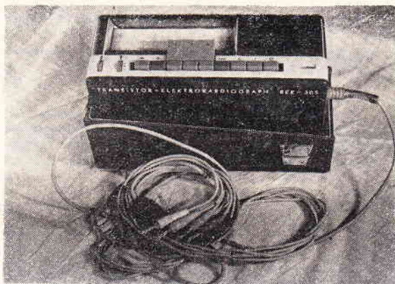
Ryc. 4. Elektrokardiograf tranzystorowy zasilany z baterii.

Teleelektrokardiografia czyli zapisywanie EKG na odległość, bez podłączania pacjenta do aparatu, ma dużą przyszłość w weterynarii (2, 3, 11). Innym usprawnieniem są produkowane ostatnio małe przenośne elektrokardioskopy tranzystorowe przystawiane bezpośrednio w okolicy serca, bez przymocowania elektrod;